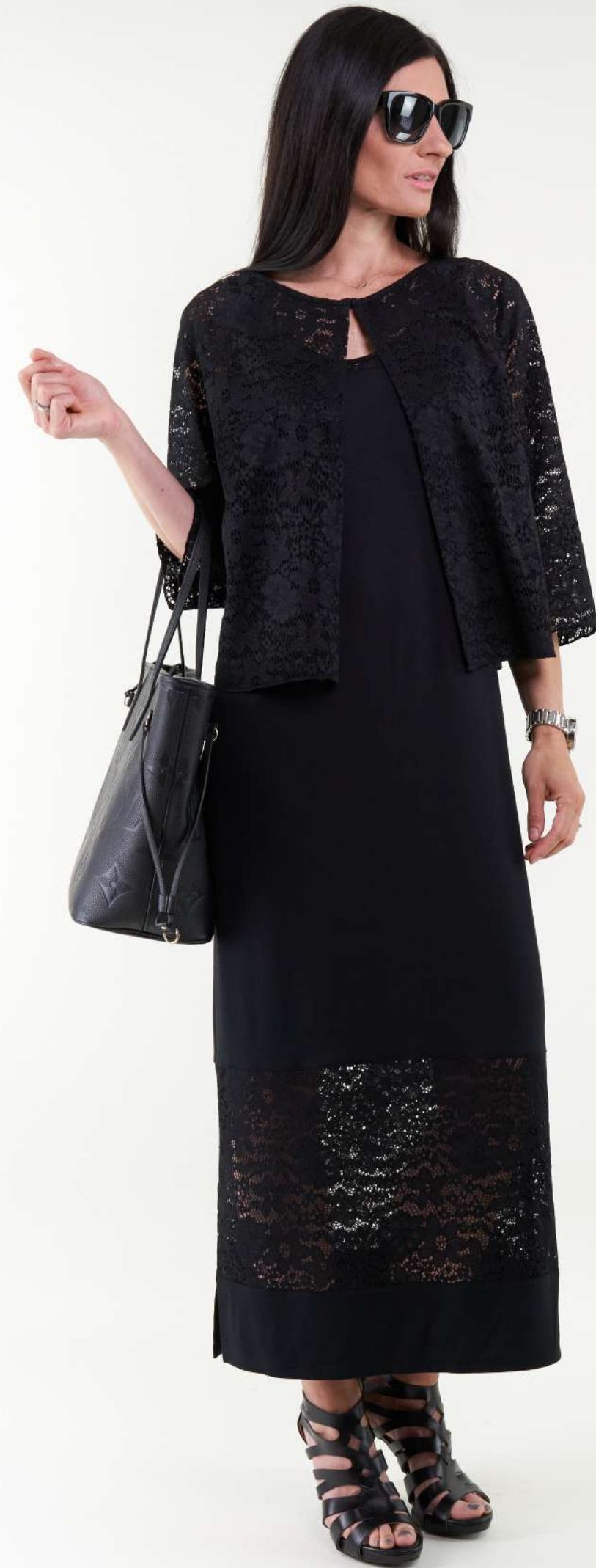
Modell Z1259 (Jacke) Kleid Z1258

MATERIAL 85% Polyester, 15% Elastan FARBE(N) 99 - schwarz, 11 - offwhite GRÖSSEN 34 - 54 RÜCKENLÄNGE 52 cm